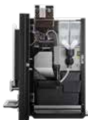
OPTIBEAN 3 (XL) TOUCH