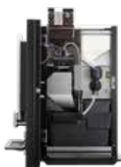
OPTIBEAN 2 (XL) TOUCH