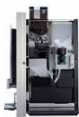
OPTIBEAN 2 (XL)