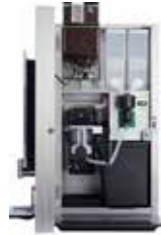
OPTIBEAN 3 (XL)